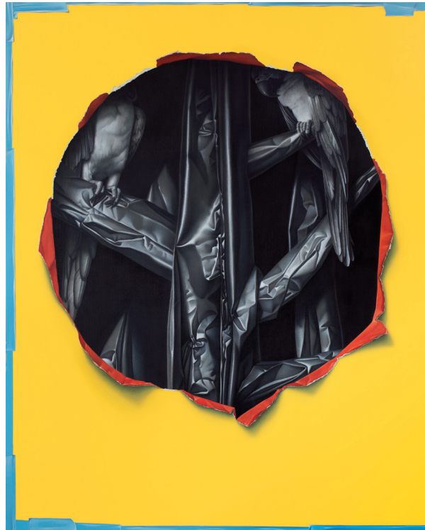
Forêt Noir, 2016, Acryl auf LW, Foto: Eckart Hahn

Der in Freiburg geborene Künstler, der international ausstellt, kommt seiner Geburtsstadt mit dieser Ausstellung geografisch sehr nah.