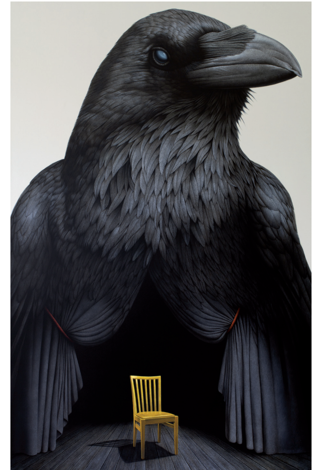
Seher, 2023, Acryl auf LW

Auch die Geburt lässt sich als eine Form des Sich-Lichtens verstehen: das Verlassen eines geschützten Ortes und der Schritt ins eigene Leben. Hahn widmet sich genau diesen Übergängen, den Nahtstellen, und verknüpft sie mit der Frage nach dem, was uns verbindet.